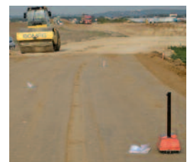
Contrôle de plate-forme de voirie