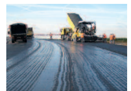
Suivi de mise en œuvre d'enrobés