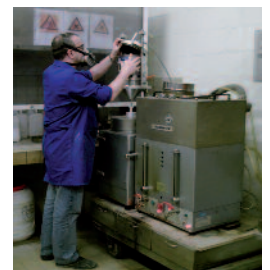
Contrôle de fabrication des matériaux enrobés