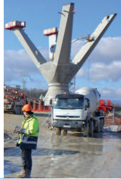
Contrôle extérieur béton viaduc de La Savoureuse (LGV Rhin Rhône)

Prélever Analyser Diagnostiquer Recommander