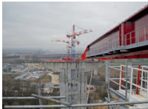
Contrôle structure métallique - Viaduc de La Côtière, A432, Lyon

Il peut mobiliser les moyens humains et matériels du réseau GINGER CEBTP avec ses experts nationaux, ses 35 laboratoires répartis sur l'ensemble du territoire et son laboratoire central de recherche et d'études d'Elancourt (78).