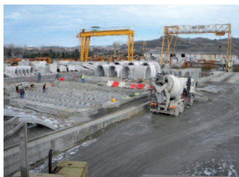
Contrôle de préfabrication - Langon Pau, A65