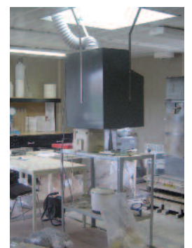
Installation de chantier-laboratoire de Lozanne (A89)