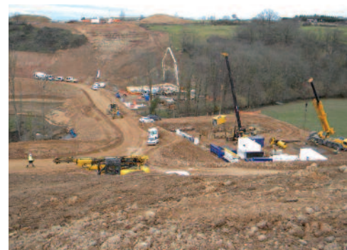
Contrôle terrassements - Les Bernands, A89