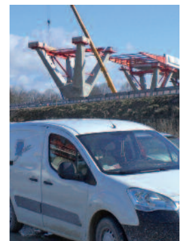
Contrôle extérieur béton viaduc de La Savoureuse (LGV Rhin Rhône)

C'est dans ce contexte que GINGER CEBTP participe depuis plus de 60 ans à tous les grands projets d'aménagement en apportant son expertise-conseil dans les domaines des ouvrages d'art, des terrassements et des chaussées.