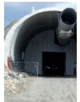
Assistance technique génie civil Tunnel de Chavannes (LGV Rhin Rhône)