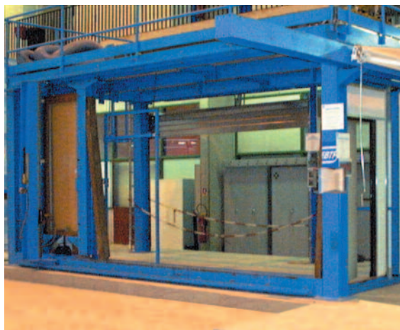
Garde corps verre