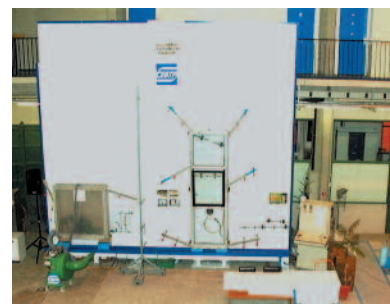
Essais murs-rideaux Certification fenêtres